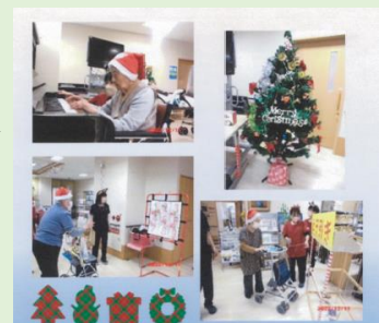
ひまわり会 職場内