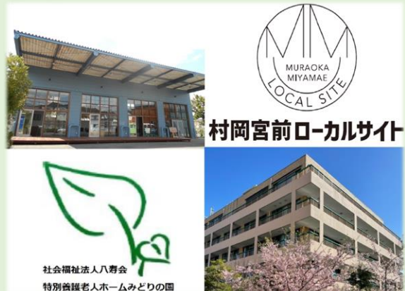
左上：村岡宮前ローカルサイト 右下：みどりの園