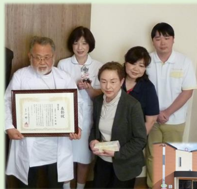
左から： 三木理事長 西出師長 岡事務長 古家センター長 田村施設長