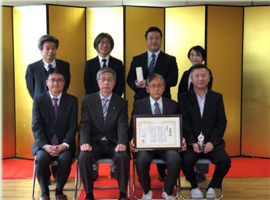
前列右から：椿施設長、八城理事長 後列：八寿会の職員の皆さん