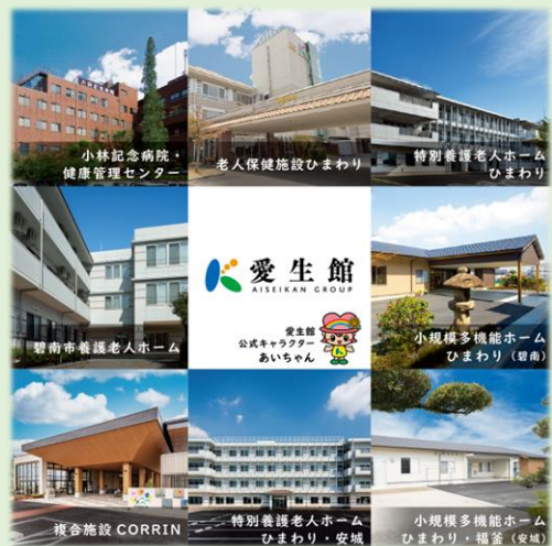
愛生館グループ事業所一覧