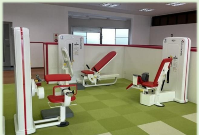
機能訓練型デイサービス「足之助」