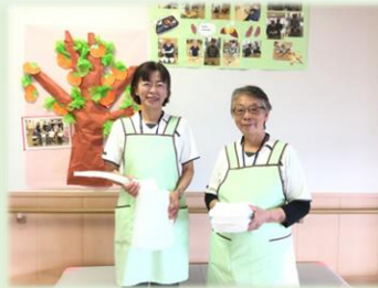
介護助手の採用 質の高いケアへ