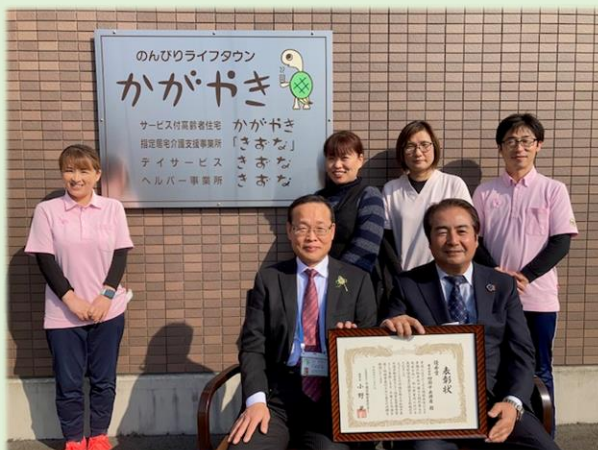
前列右から：受川社長、真鍋施設長 各事業所管理者の皆さま