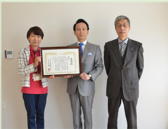
左から：村松介護・福祉地域事業部門長、小林理事長