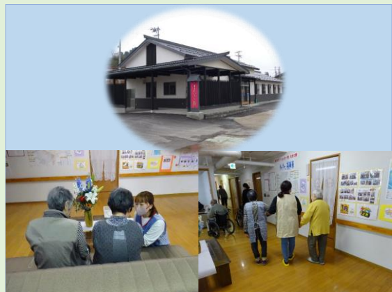
バリエーション風景