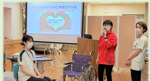
地域交流セミナー